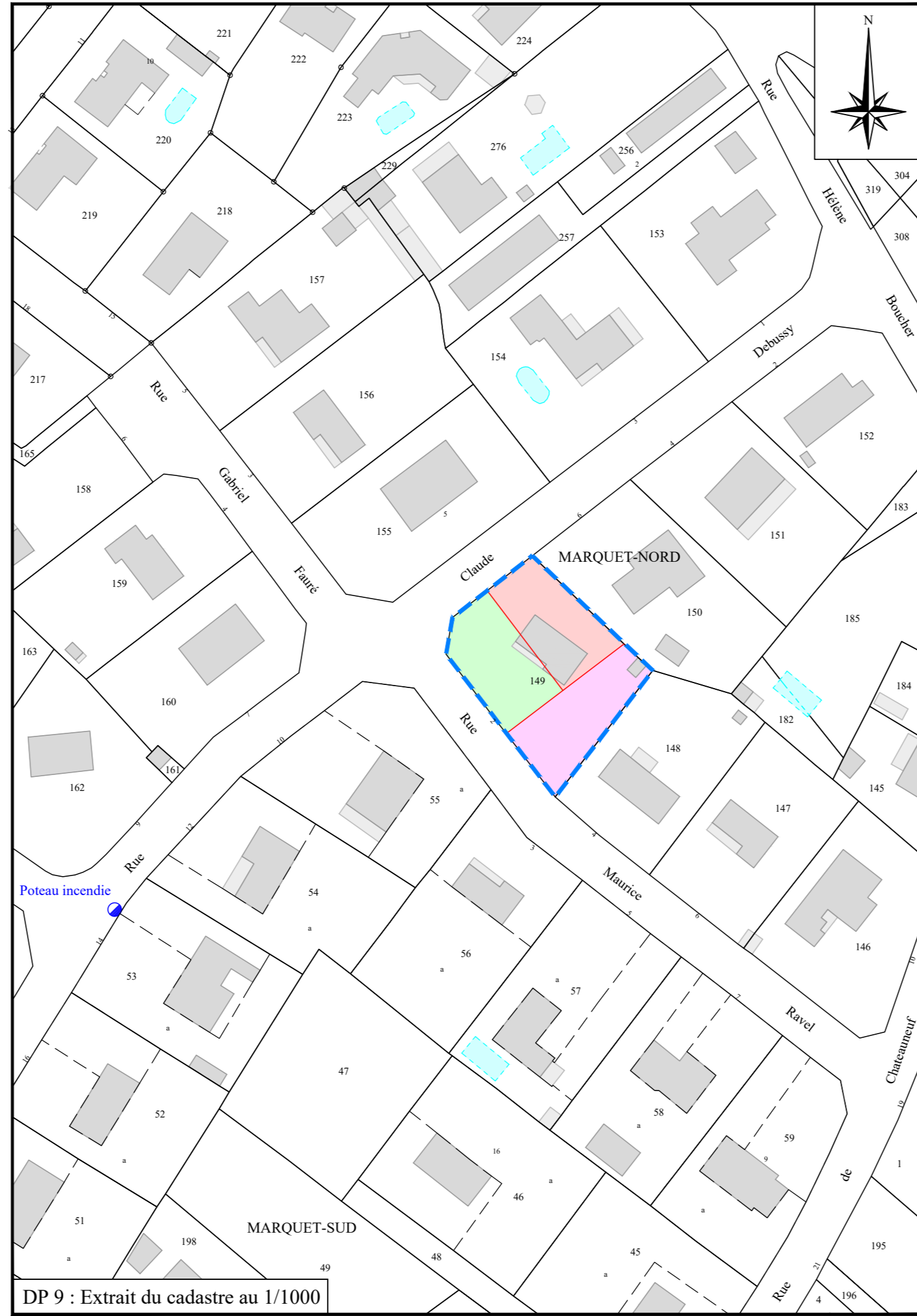
DP 9 : Extrait du cadastre au 1/1000

Fichier : 18595.dwg / dao 10 / M.S. / F.B.